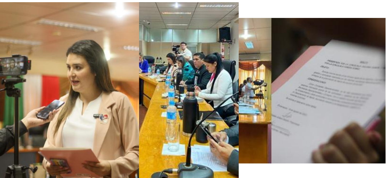
Fotografías de la primera sesión ordinaria de la Junta Departamental de Itapúa.

La misma fue tratada en comisión y nos han remitido algunas documentaciones que se han presentado ante la Junta Departamental de las diferentes secretarías que presentaron dichos informes.